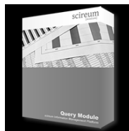
scireum Query Module